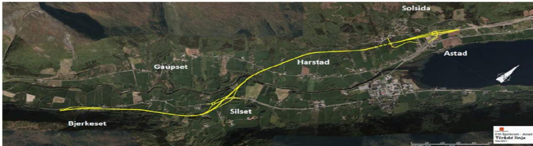
Figur 18 Tilrådd løsning for ny E39